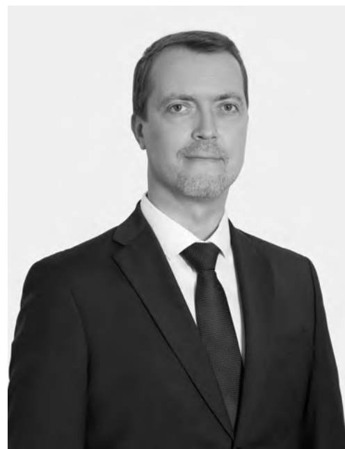
Аркадий Зинов, министр культуры Красноярского края

Рад, что теперь мы имеем честь принять и Форум-фестиваль на нашей гостеприимной земле. Уверен, что представленные на фестивале работы затронут сердца зрителей, заставят задуматься и вдохновят на творческие свершения.